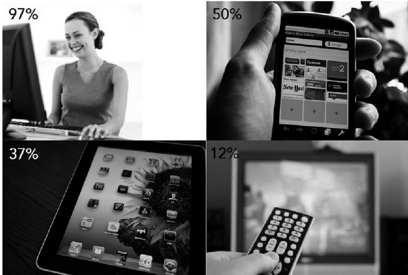
Figuur 3: op welke apparaten gebruik jij internet (n=1.106)